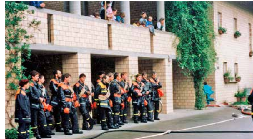
Feuerwehr Übung 1988