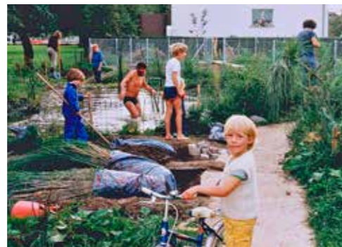
Biotop Gestaltung 1982