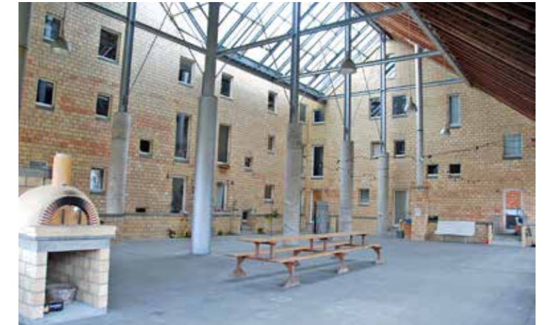
Innenhof mit Sicht gegen die Hauseingänge

Schon bald leisteten erste «Hofstätter» aktive Arbeit im Gemeinderat, was der Siedlung erste Anerkennungen einbrachte.