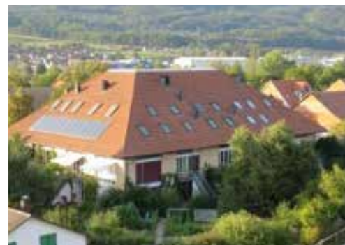
Die Hofstatt von einem Kran aus

Der Bericht entstand auf Anfrage der Redaktion. Herzlichen Dank für den spannenden Einblick.